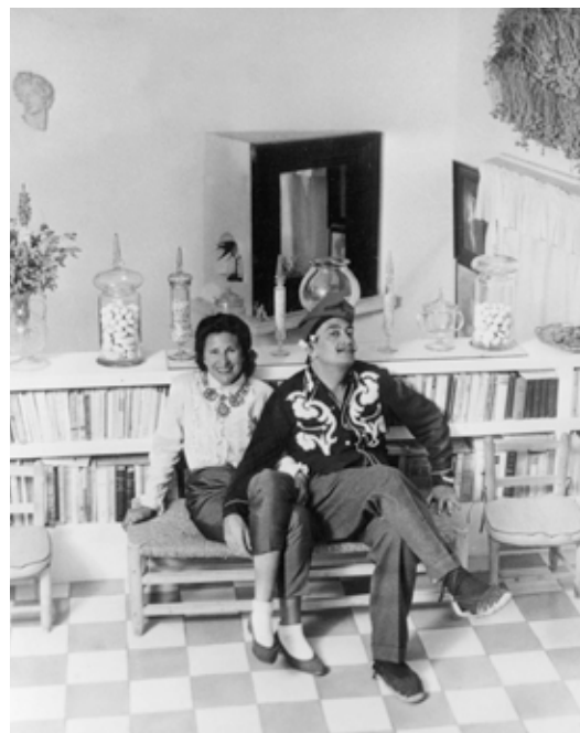
ONMISKENBAAR SPAANS , deze bibliotheek, met terracotta tegels op de vloer, een haard van wit stucwerk, lage zitjes en elegante chauffeuses. De surrealistische zwanen lijken elk moment te kunnen opvliegen. RECHTERPAGINA