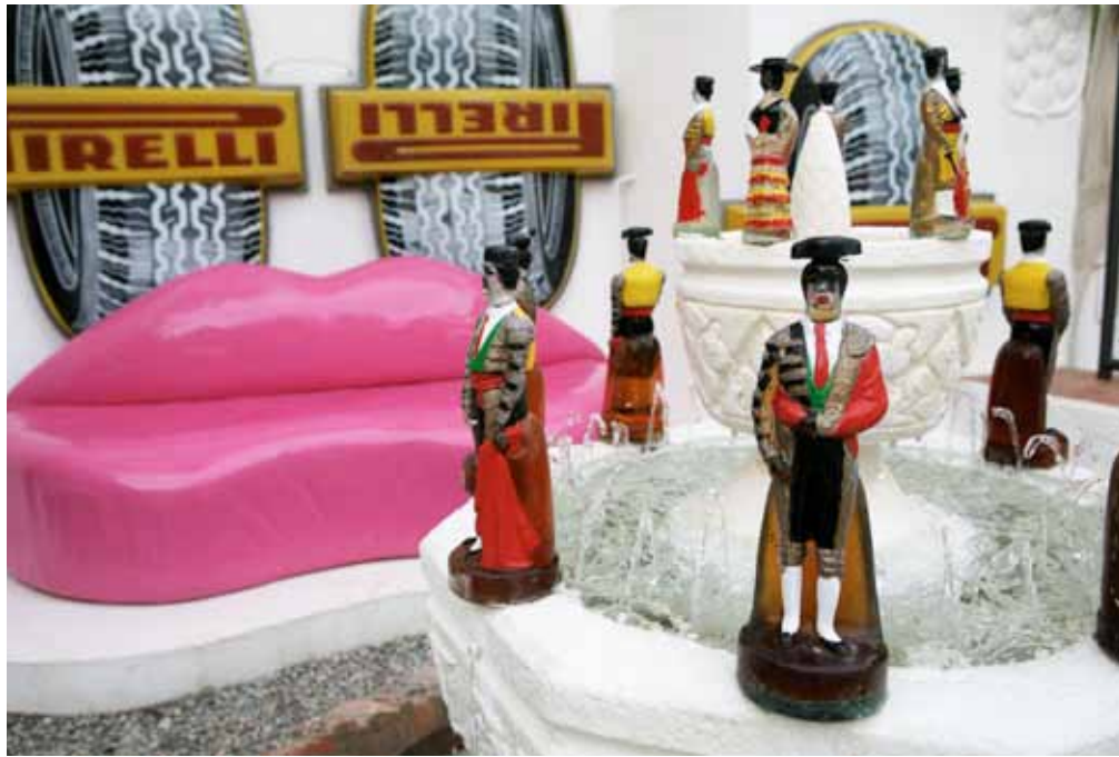
SPAANSE TOREADORS omringen de de fontein van wit stucwerk: een van de meest surrealistische hoeken van het complex. Erachter staat een hardroze versie van Dalí's bank Mae West. Aan de muren hangen manshoge reclameposters van bandenfabrikant Pirelli.

De twee optrekjes worden door hem via een kleine aanbouw met elkaar verbonden, en Dalí is content met zijn nieuwe woon- en werkplek. Het landschap, het licht en de geïsoleerde ligging zijn hem op het lijf geschreven en hij werkt er lustig op los. De schilder van adellijke komaf – zijn volledige naam is Salvador Domingo Felipe Jacinto Dalí i Domènech, markies de Dalí de Púbol – voelt zich hier thuis. “Dit is een epische plek, waar de Pyreneeën naar de zee buigen, als een grandioos geologisch delirium.” Tot de dood van zijn vrouw Gala in 1982 zal hij gedurende de acht mooie maanden van het jaar blijven wonen in Port Lligat. “Iedere morgen wanneer ik wakker word, is mijn grootste vreugde dat ik Salvador Dalí ben.”