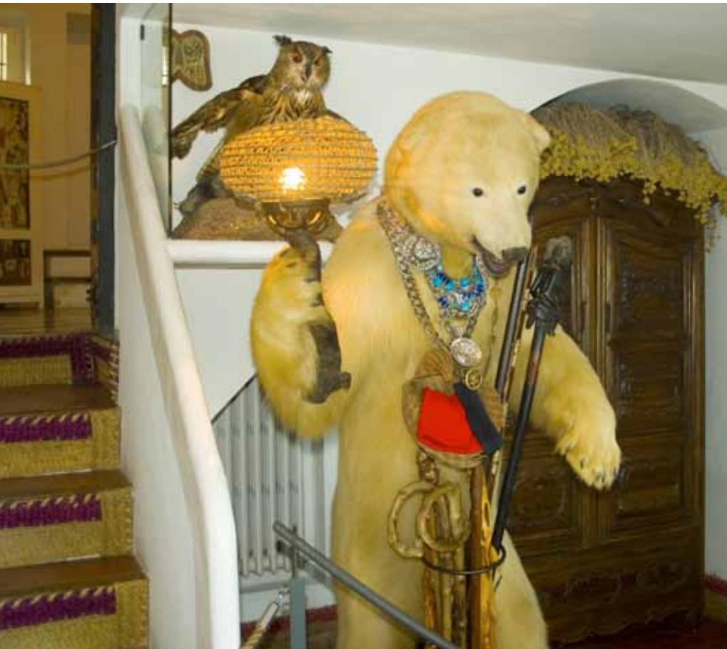
DE BERENKAMER is vernoemd naar deze opgezette beer die ook dienst doet als wandelstokhouder en schemerlamp. De ruimte vormt het centrum van het labyrintachtige huis. BOVEN